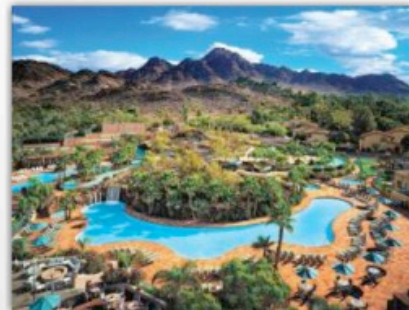
Hilton Phoenix Resort at the Peak